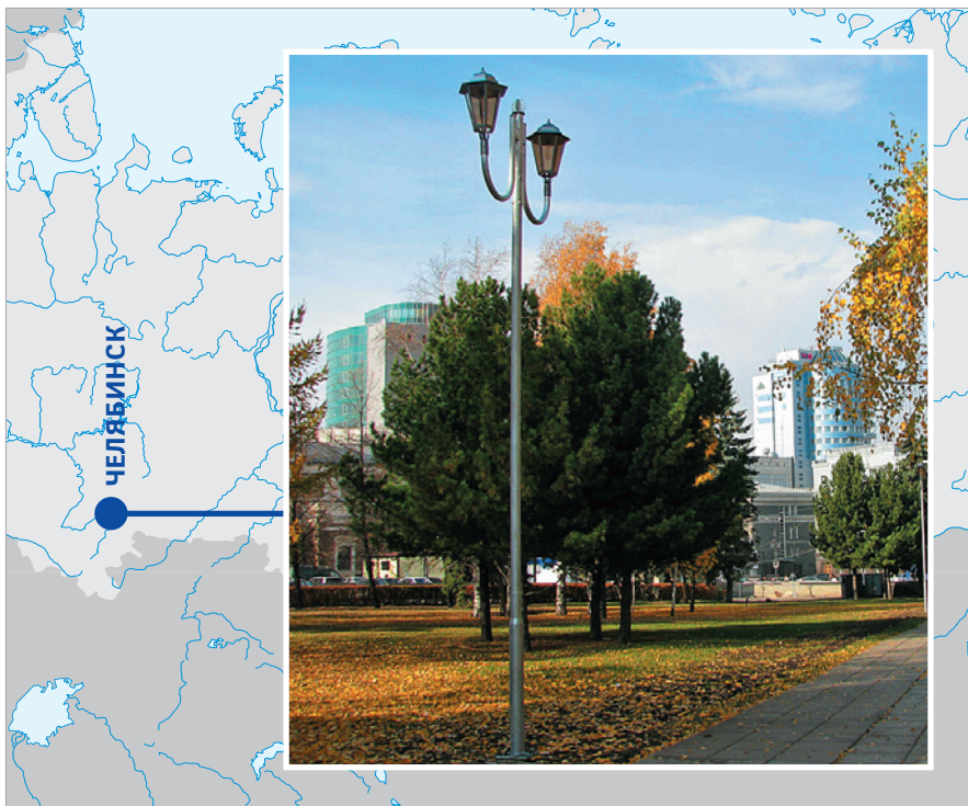
Челябинск. Площадь Революции